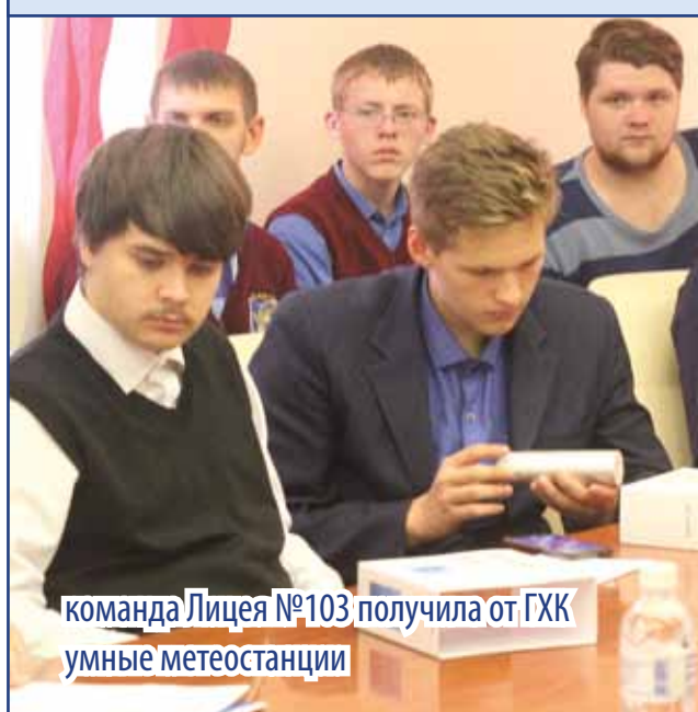
команда Лицея №103 получила от ГХК умные метеостанции