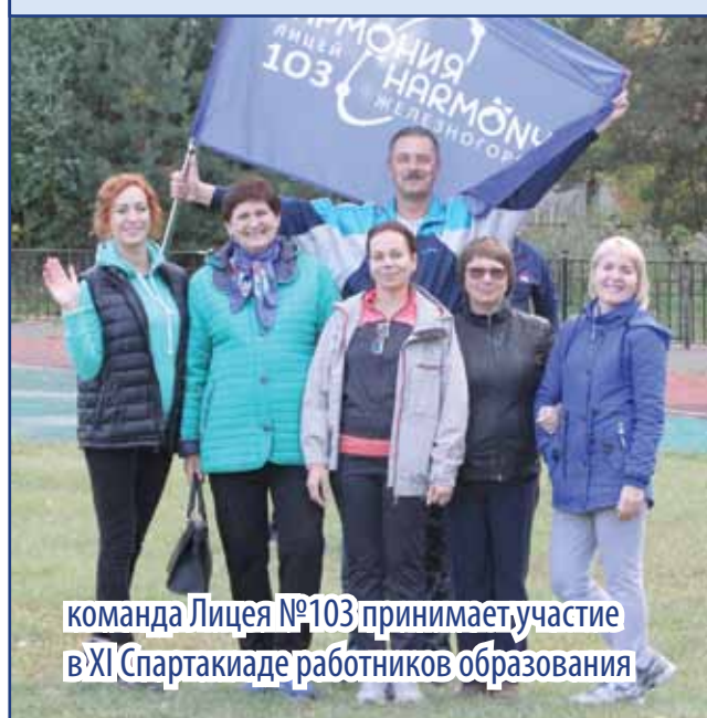
команда Лицея №103 принимает участие в XI Спартакиаде работников образования