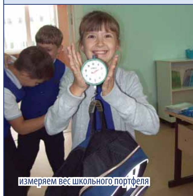
измеряем вес школьного портфеля